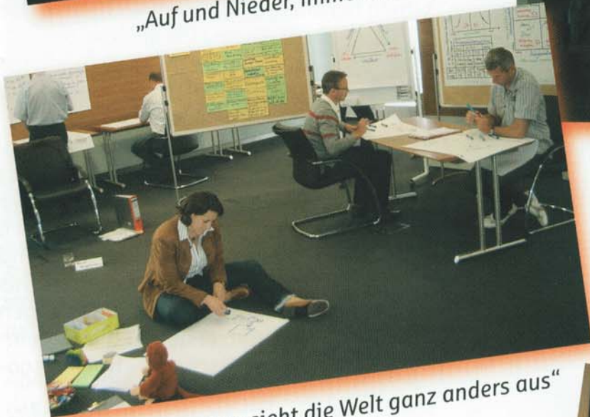
„Von hier unten sieht die Welt ganz anders aus“