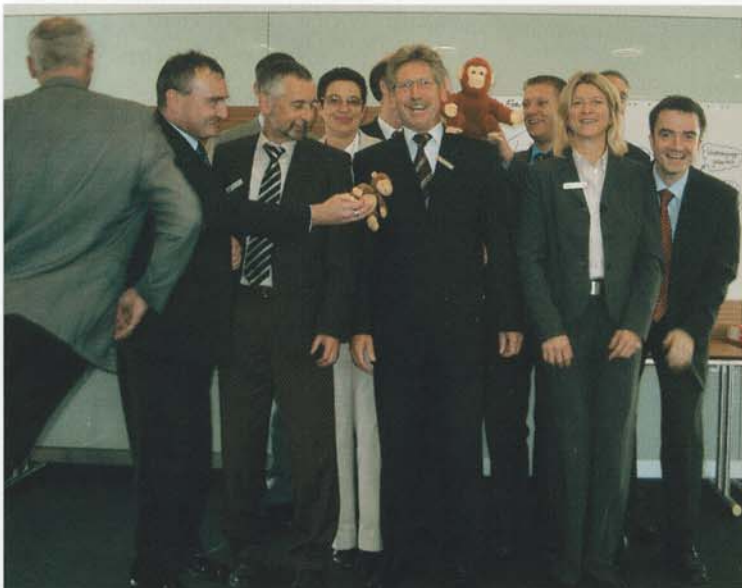
„Ich krieg die Kurve doch noch“