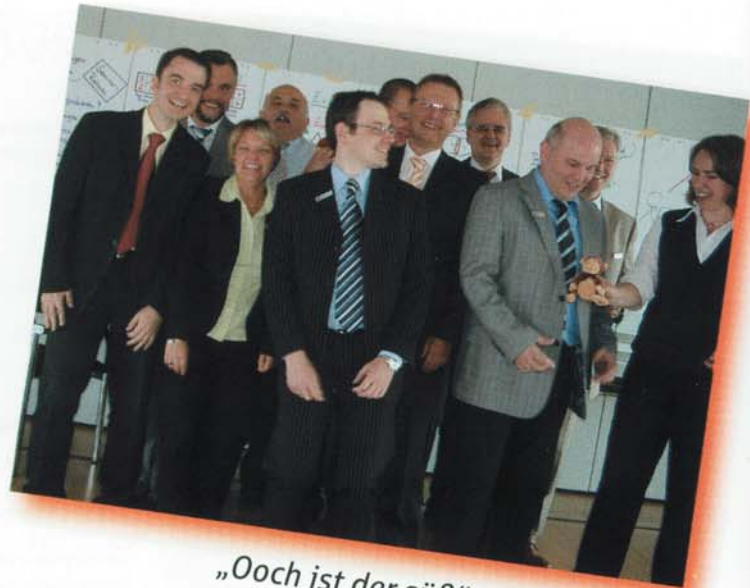
„Ooch ist der süß“

Führen und Beurteilen - mit diesen beiden Themen haben sich die Führungskräfte in ihrem Seminar auseinander gesetzt. Gesprächsleitfäden und Hintergrundwissen wurden an den jeweils fast drei Tagen interessant und kurzweilig vermittelt. In den Trainingsgesprächen flog der Affe nur so hin und her. Jeder durfte und wollte ein-