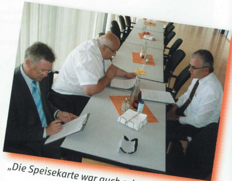
„Die Speisekarte war auch schon mal besser!“