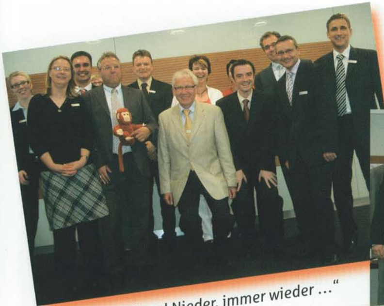
„Auf und Nieder, immer wieder ...“