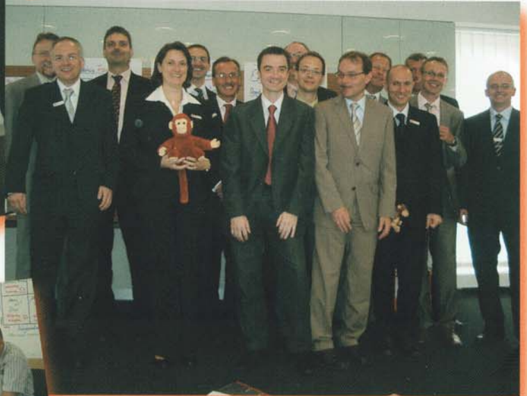
„Ich will aber in die Mitte“