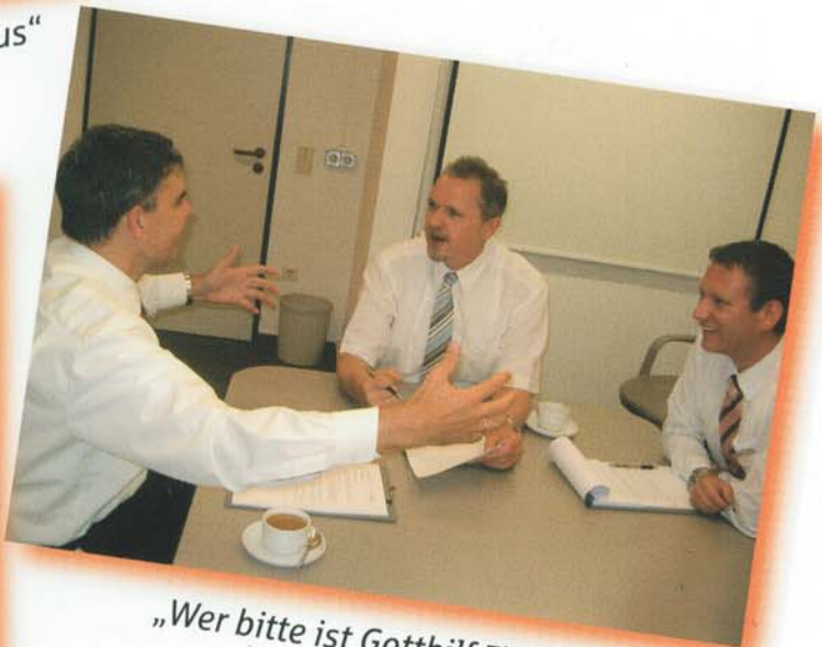
„Wer bitte ist Gotthilf Fischer?“