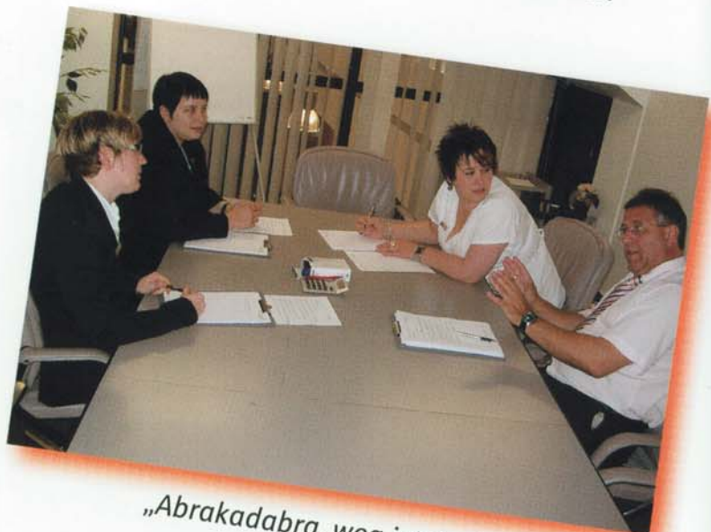
„Abrakadabra, weg ist der Kuli!“